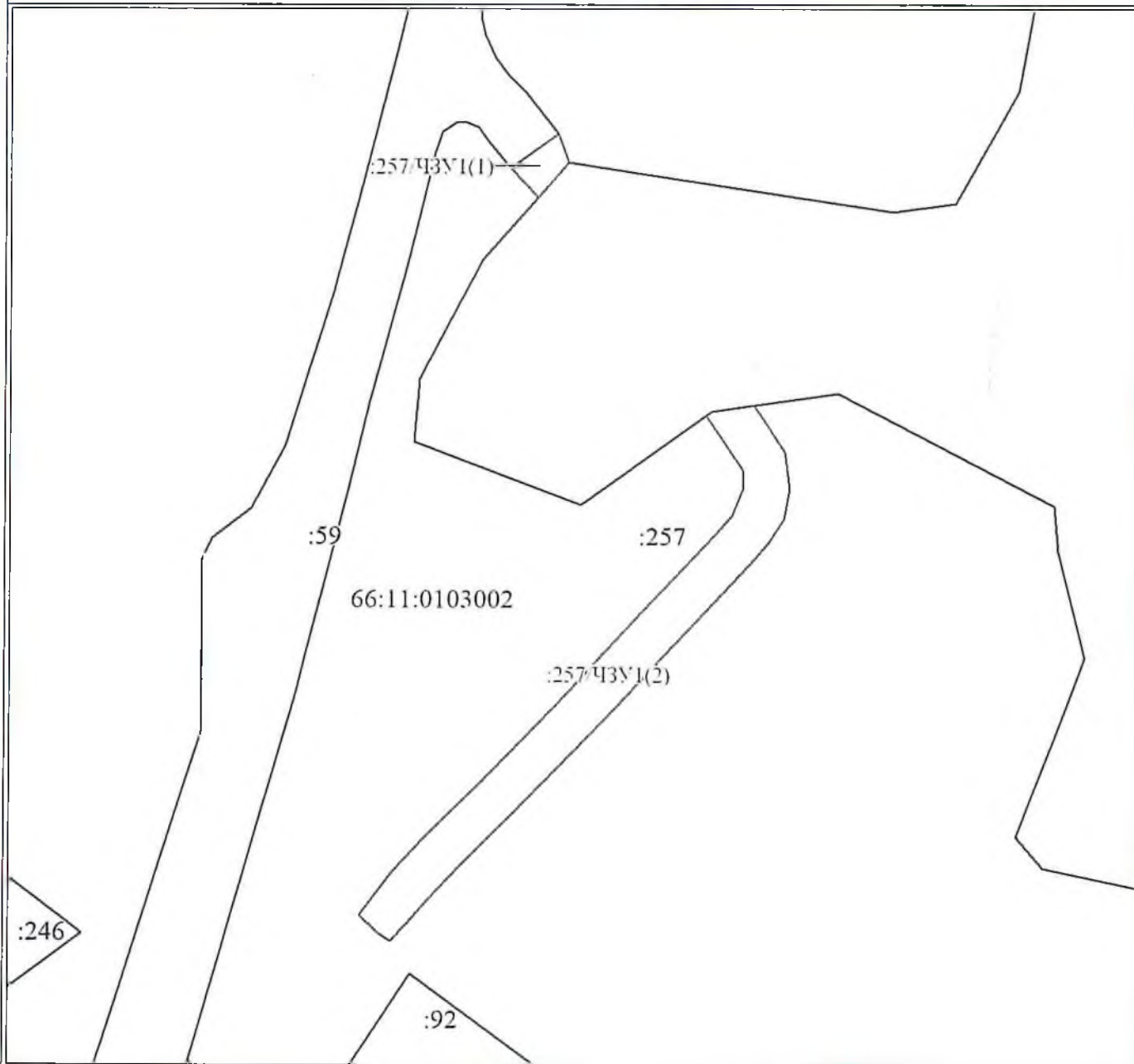
Схема расположения земельных участков