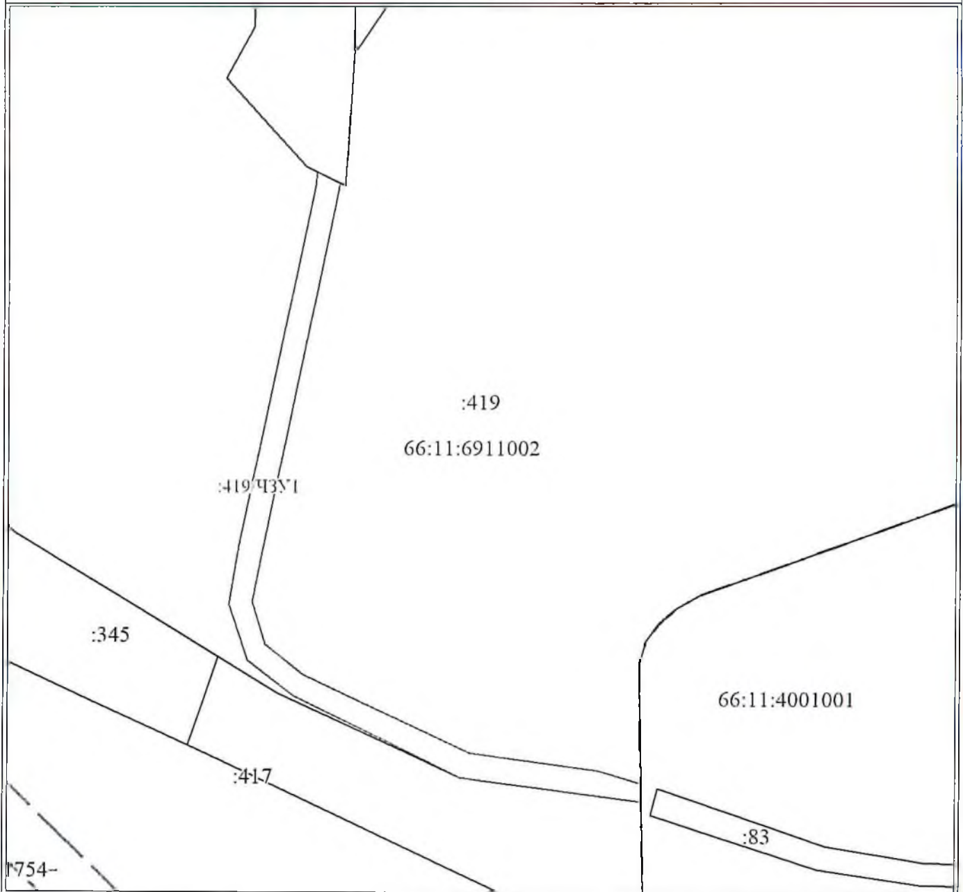
Схема расположения земельных участков